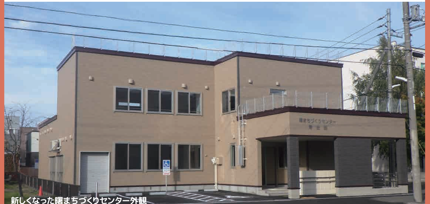
新しくなった曙まちづくりセンター外観

☆12月9日（月）の午後1時から午後4時まで、曙会館運営委員会主催による「曙会館見学会」を開催しますので、是非お越しください。