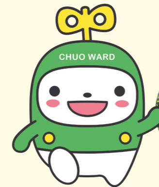
中央区マスコットキャラクター「中ウオークん」