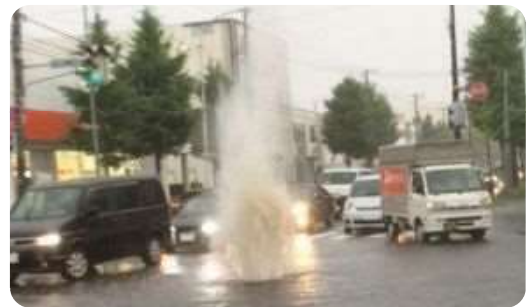
東区伏古(平成26年8月)