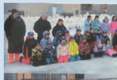
▲スノーキャンドルイベントの様子 たくさん子どもたちが参加してくれました。

コロナ禍前のような大規模な交流事業はできなくても、役員のできる範囲で子どもたちと一緒に楽しめるイベントから始めてみませんか。子育て世代や若い世代の参加のきっかけになるはずです。