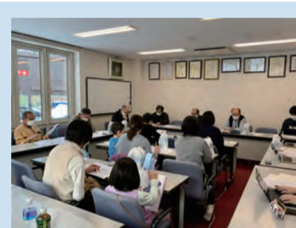
▲町内会の会議の様子 町内会の会議には、お子さんを連れて参加するサポーターの姿も。

います。役員の周りの方々への声かけでは新たな担い手が見つからない場合でも、アンケートで担い手不足を知ってもらい、担い手を募集することで新たな人材を発掘できるかもしれません。