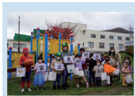
▲ハロウィンイベントの様子 役員・サポーターで企画したハロウィンイベント。たくさんの親子連れが参加しました。

現在、サポーターの方が総務副部長に就任されており、役員の担い手確保にもつながっています。