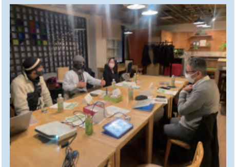
▲町内会未来塾+LABOの様子 子育て世代や若い世代から多くの意見をいただきました。

高齢者向けの活動に加えて、若い世代や子育て世代向けの活動を行うことが町内会の関心を高めることに繋がりそうです。