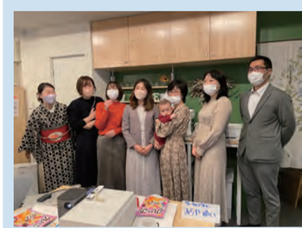
▲町内会未来塾+LABOの様子 第2回の開催はお子さんを連れた参加もあり、楽しくお話しができました。

に関して様々な話をする機会を全3回設けました。地域コミュニティやまちづくりに関心がある参加者が多く、その声を聞くと若い世代や子育て世代も地域コミュニティを必要としていることがわかりました。コロナ禍もあってか、若い世代は「孤独」を感じている人が多く、地域の人と気軽に話ができる場所があると良いといった意見が出されていました。