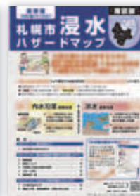
▲浸水ハザードマップ