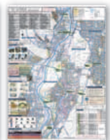
▲土砂災害避難地図